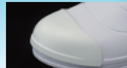
つま先安心ガード付きも